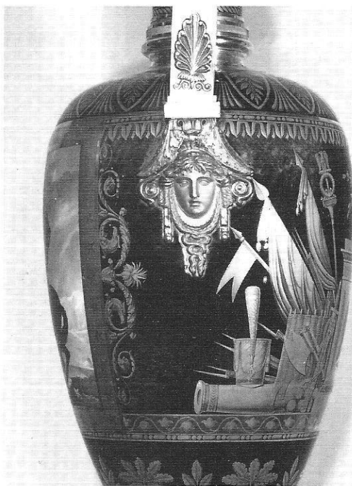
124, détail de l'anse