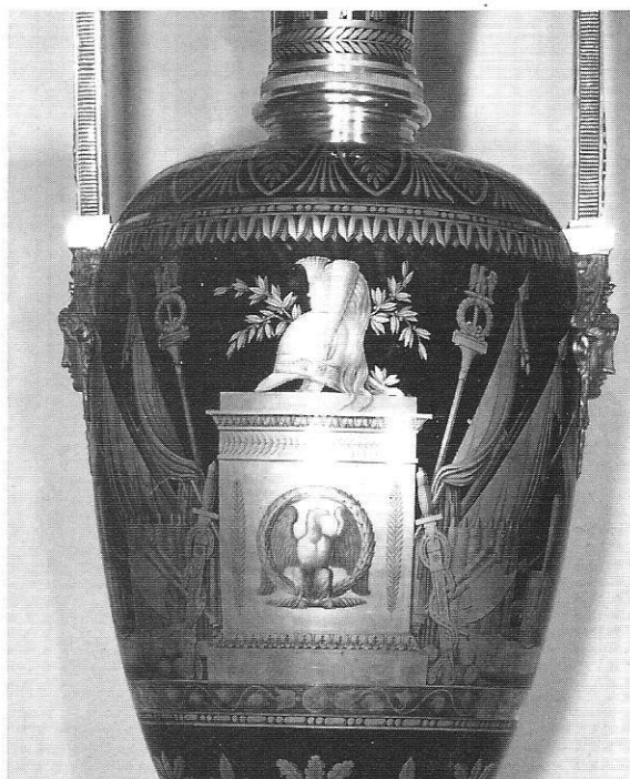
124, détail du revers