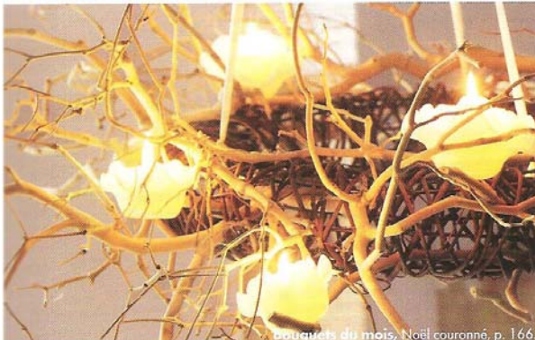
Bouquets du mois, Noël couronné, p. 166.