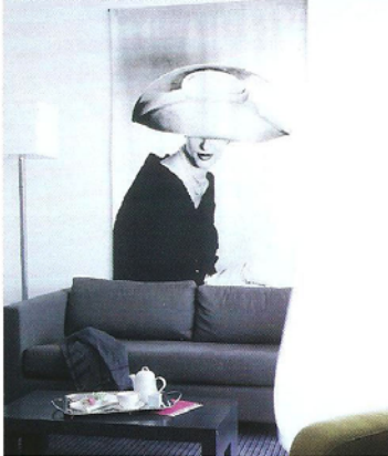
A Marseille, le New Hotel, p. 158.