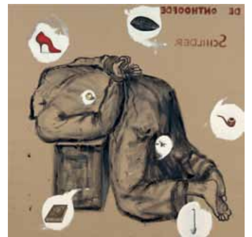
Marc Maet, 'The Decapitated Painter', 1997, 200 x 200 cm

Marc Maet liet zich tijdens het schilderen dan wel leiden door zijn demonen, evengoed was hij een belezen man met een goede kennis van de kunstgeschiedenis. Uit de filosofie, de wereldliteratuur en de Belgische kunstgeschiedenis putte hij zijn vele referenties, symbolen en figuren. Ook zindert er een autobiografische laag in zijn doeken. Citaten als "Niets denken, niets voelen" en vanitasmotieven zoals het doodshoofd, de roos en de spiegel behoeven geen verdere uitleg. In andere schilderijen leverde de kunstenaar een commentaar op de kunstwereld. Dat deed hij bijvoorbeeld door het schilderen van narrenmutsen als een vorm van zelfspot. Voelde de kunstenaar zich een clown die geacht werd te dansen naar de pijpen van de kunstwereld? In ieder geval kon Maet het niet langer opbrengen. De narrenmuts was volgens Maet evengoed bestemd voor de curatoren die het aandachtig kijken hadden verleerd en enkel nog afgingen op wat er de ronde deed