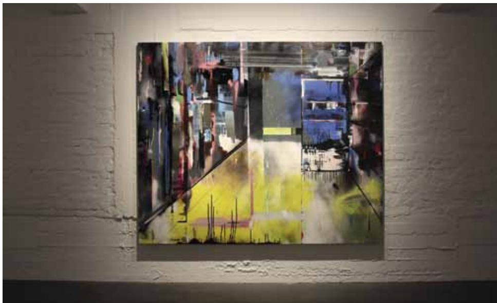
■ Roberto Polo Gallery, expo Silent Treatment van Mil Ceulemans

over welke kunstenaars al dan niet het label 'topkunstenaar' verdienen. Roberto Polo is ervan overtuigd dat een galerie die geen 'officiële' topkunst brengt toch een topgalerie kan zijn. Volgens hem is de kwaliteit van een galerie eerst en vooral af te lezen aan de sterkte van het werk dat ze brengt en niet aan de handtekening van de kunstenaars die ze vertegenwoordigt. Ten tweede vindt hij dat een topgalerie een galerie is die het klaarspeelt om kunstenaars