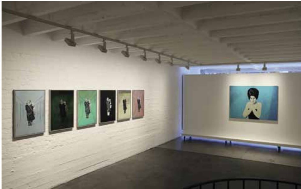
■ Roberto Polo Gallery, expo Closed Doors van Jan Vanriet