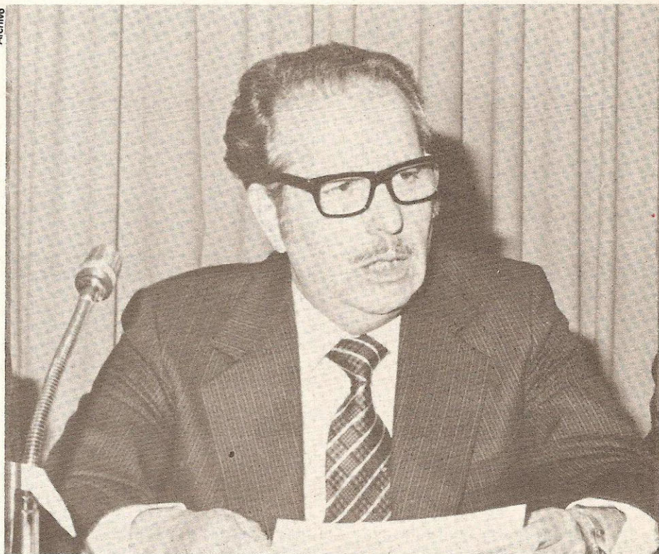
Martínez Manautou. Fórmulas, claves, rutas del saqueo

Este es el contenido textual de la carta: